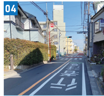
04 丸山集会所交差点信号・県道修繕