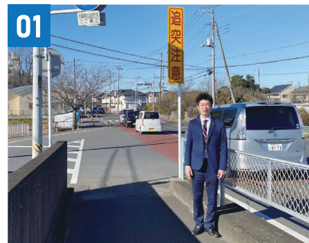
01 さぎの森小 渋滞対策