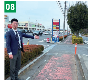
08 アクロスプラザ前