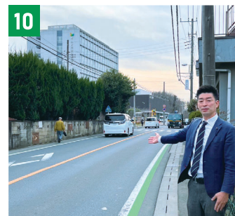
10 イムス三芳前歩道拡幅