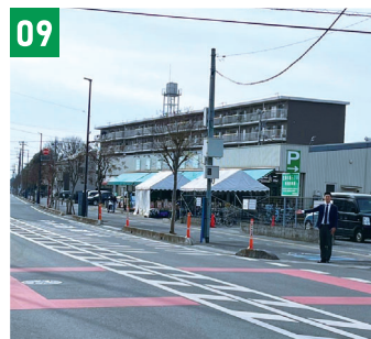
09 田中青果前信号・横断歩道設置