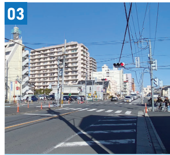
03 上福岡駅踏切通り県道整備