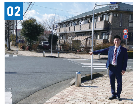
02 東原小周辺交通安全対策