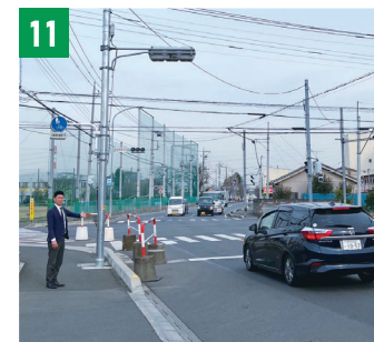
11 三芳中学校前交差点、右折帯整備