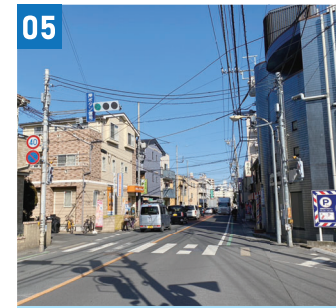
05 銀座バーバー前信号機更新