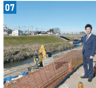
07 新河岸川護岸・堤防